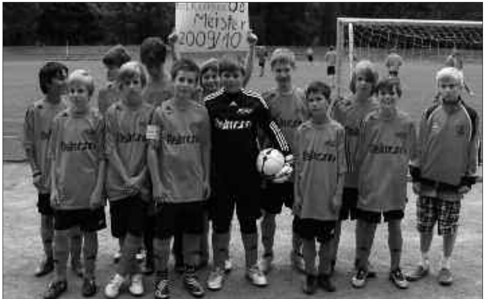
Staffelsieger Kreisklasse 2009/2010 D-Junioren: FC Falkensee 08