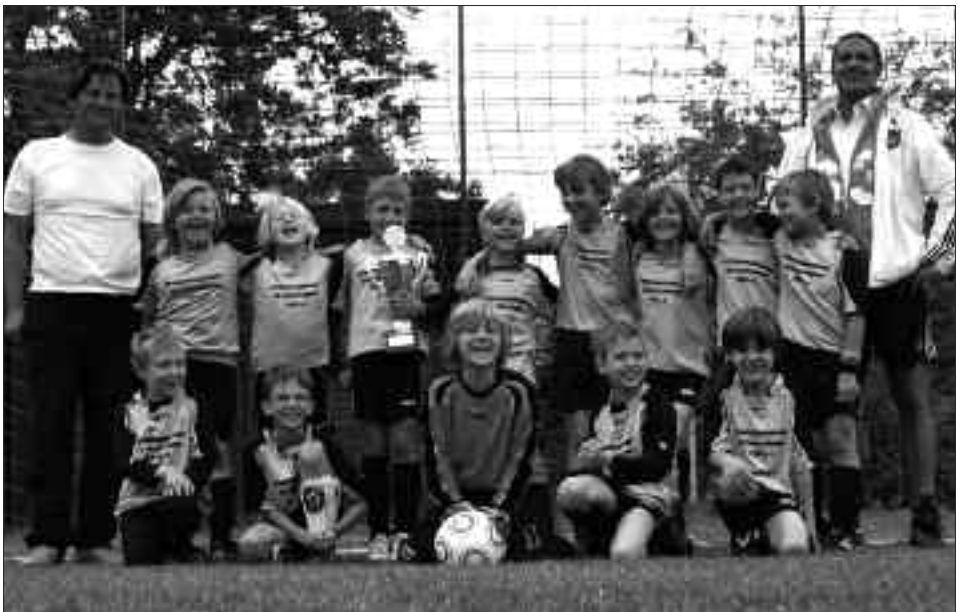
Staffelsieger Kreisklasse 2009/2010 F-Junioren: SV Ferch 1948