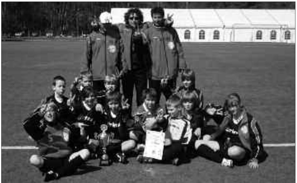
Staffelsieger Kreisklasse 2009/2010 E-Junioren: FSV 95 Ketzin/Falkenrehde