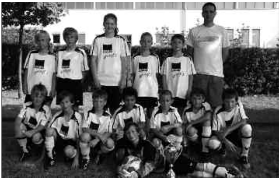
Staffelsieger Kreisklasse 2009/2010 E-Junioren: Fortuna Babelsberg II