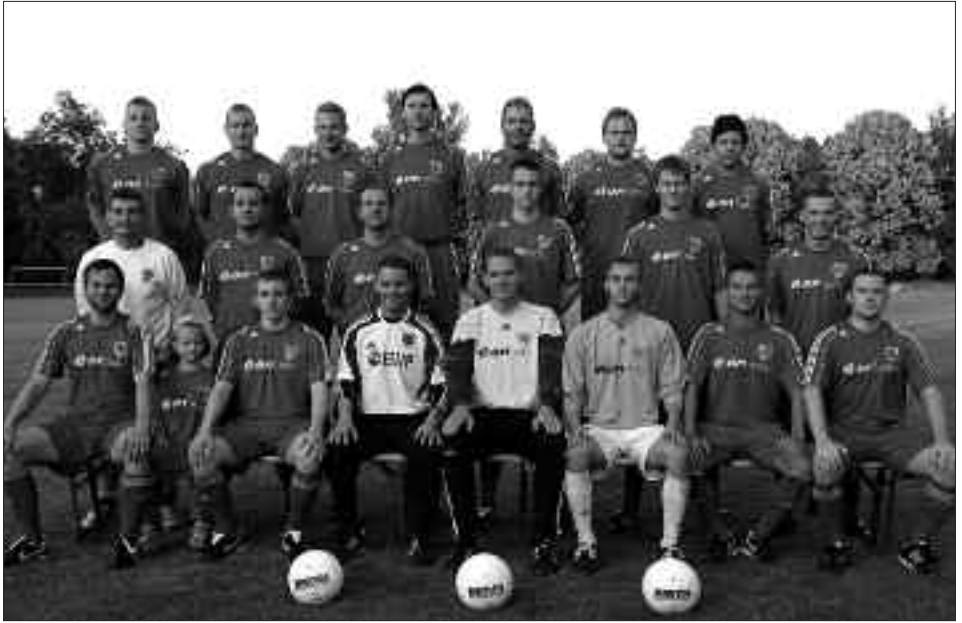
Kreismeister 2009/2010: SV Babelsberg 03 III