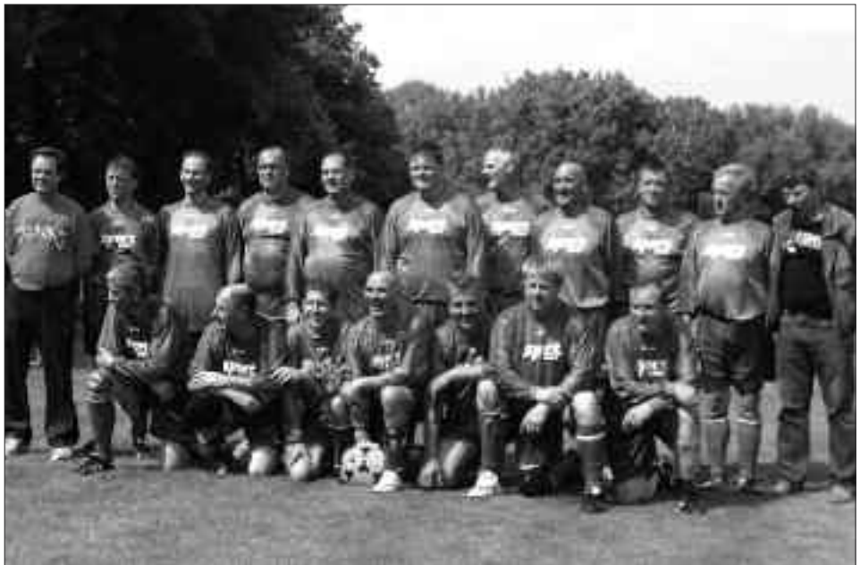
Staffelsieger Senioren-Kreisklasse Ü 40 2009/2010, Staffel A: VfL Nauen