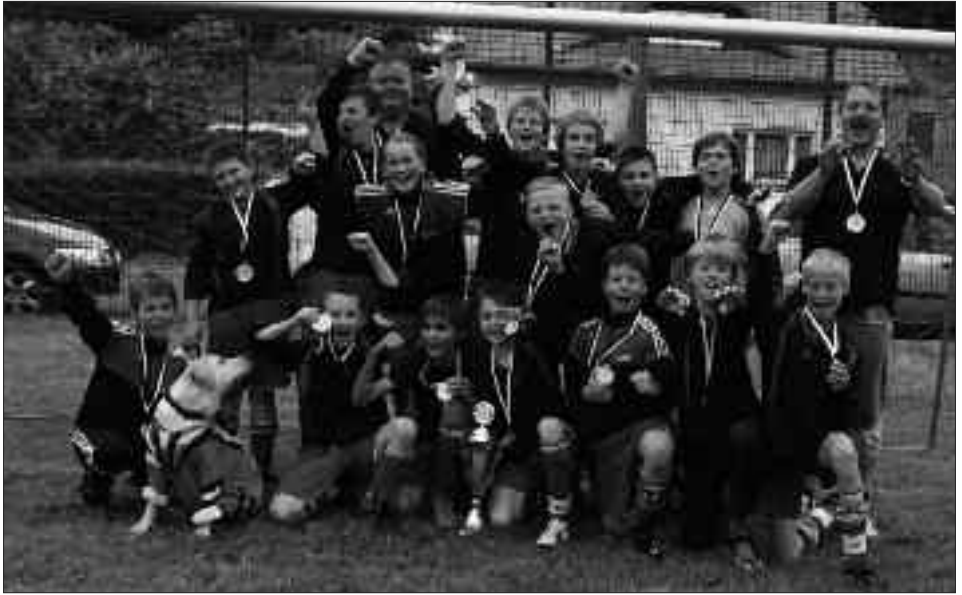
Kreispokalsieger 2009/2010 D-Junioren: ESV Lok Seddin