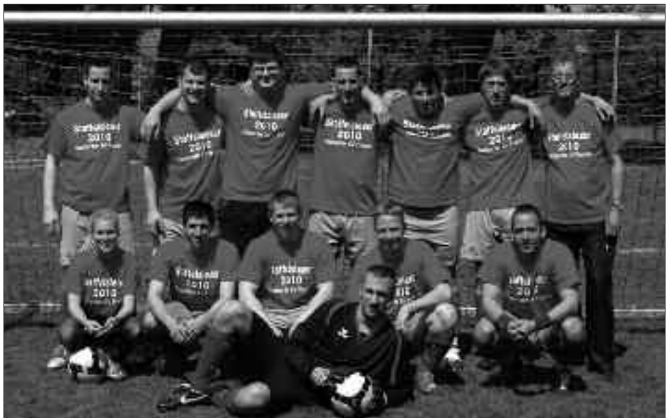
Staffelsieger Freizeitliga 2009/2010, Staffel A: Seeburger SV 99 Freizeit