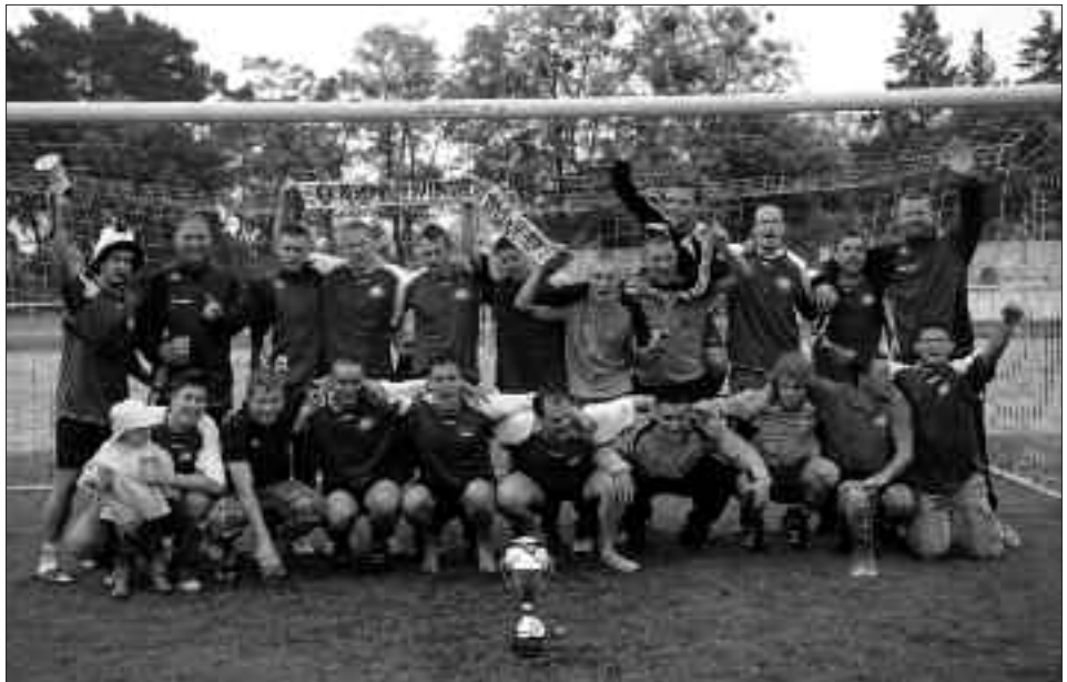
Staffelsieger 1. Kreisklasse 2009/2010: RSV Eintracht Teltow II