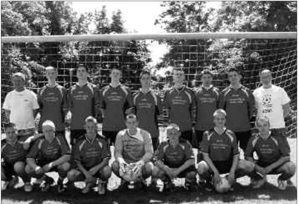
Kreispokalsieger 2009/2010 A-Junioren: SG Michendorf/Caputh