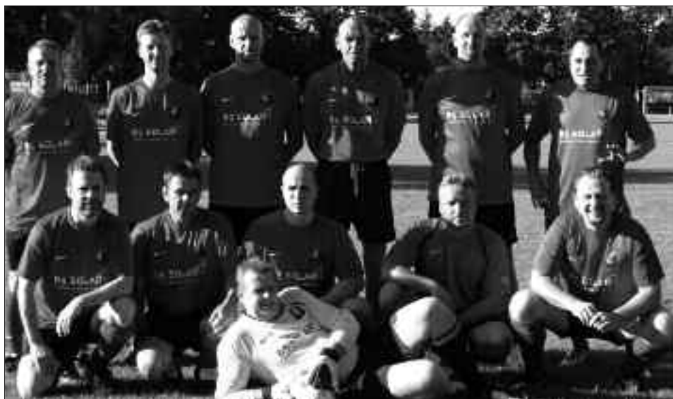
Staffelsieger Senioren-Kreisklasse Ü 40 2009/2010, Staffel C: ESV Lok Elstal