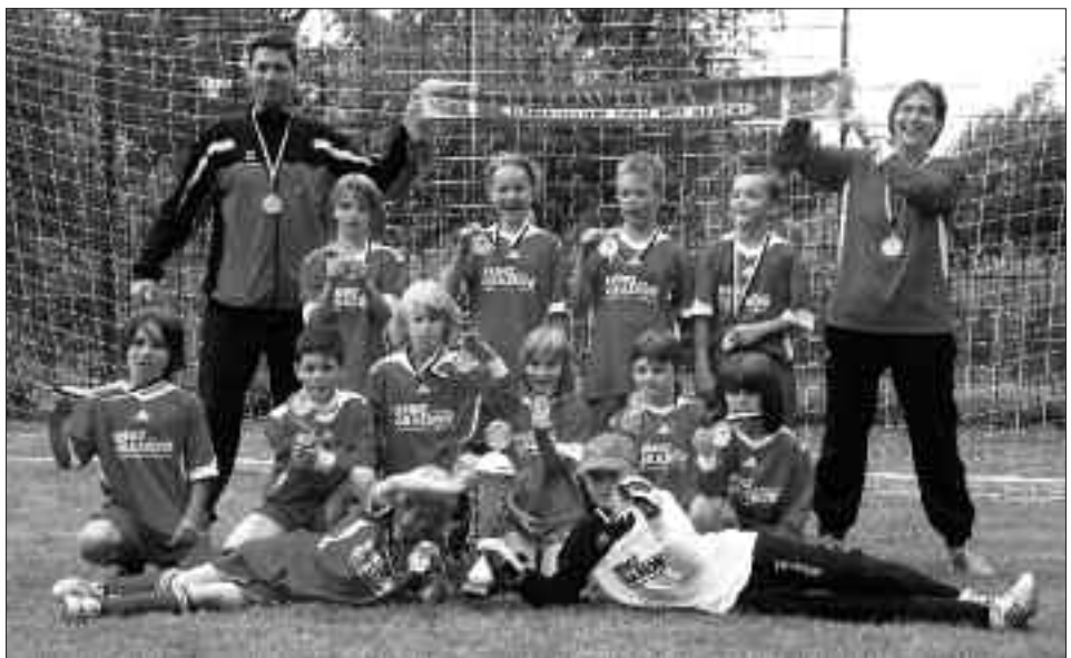
Kreispokalsieger 2009/2010 F-Junioren: Teltower FV 1913 I