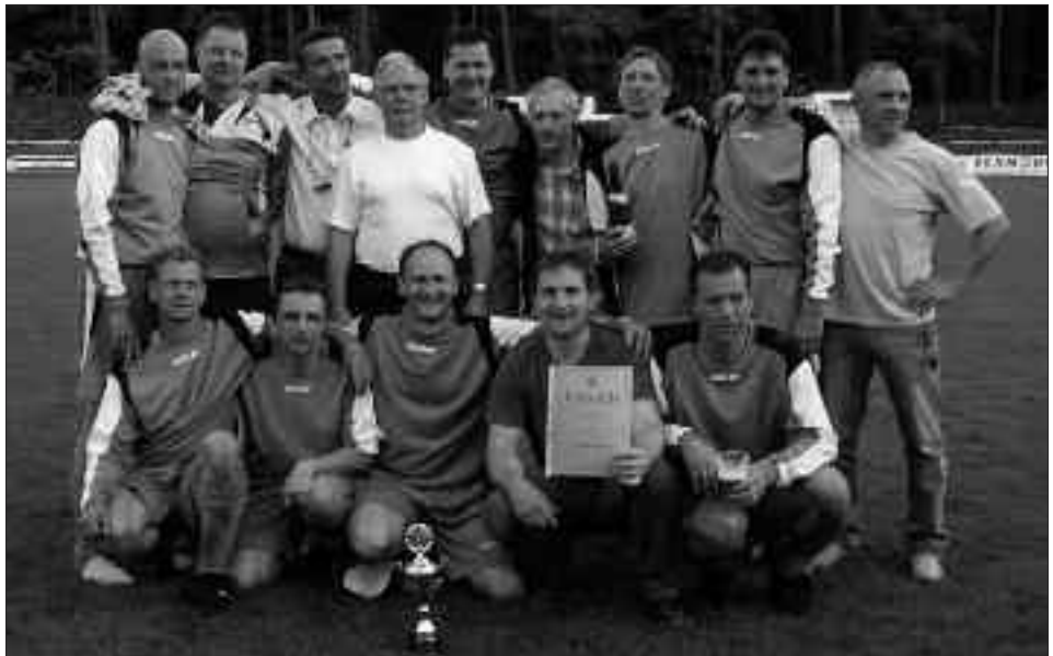
Sieger Seniorenpokal Ü40 2009/2010: Caputher SV 1881