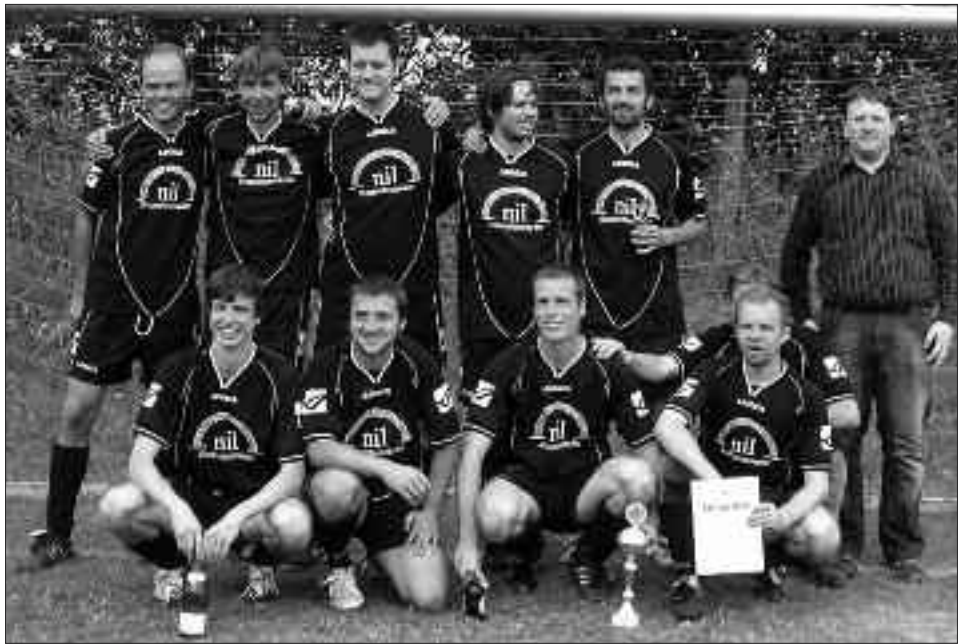
Kreismeister Freizeitliga 2009/2010: UFK Potsdam