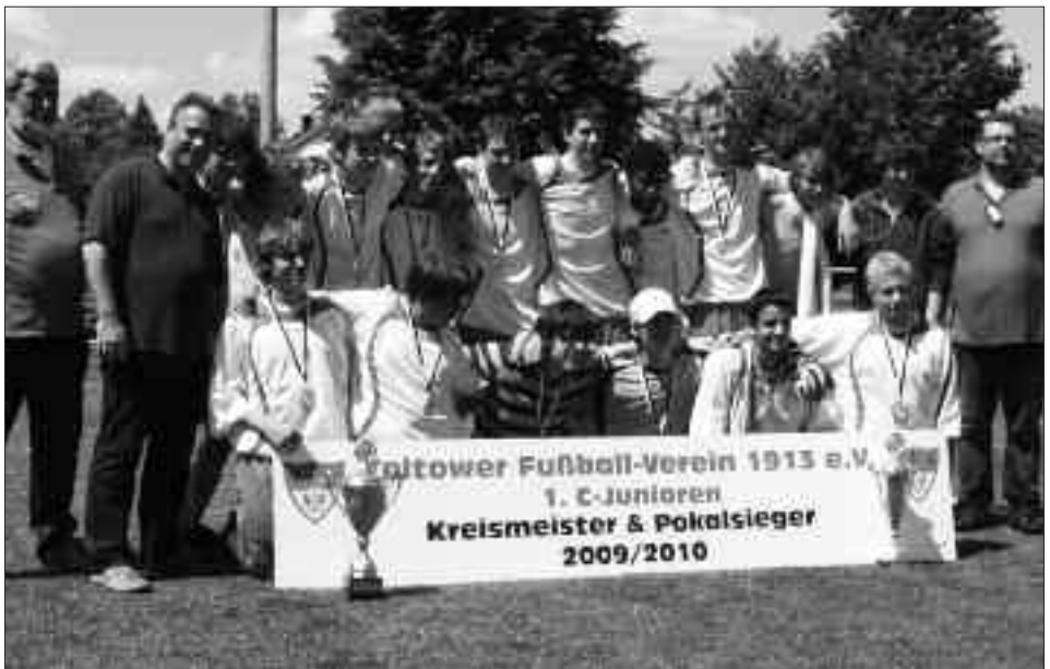
Kreismeister und Pokalsieger 2009/2010 C-Junioren: Teltower FV 1913 I