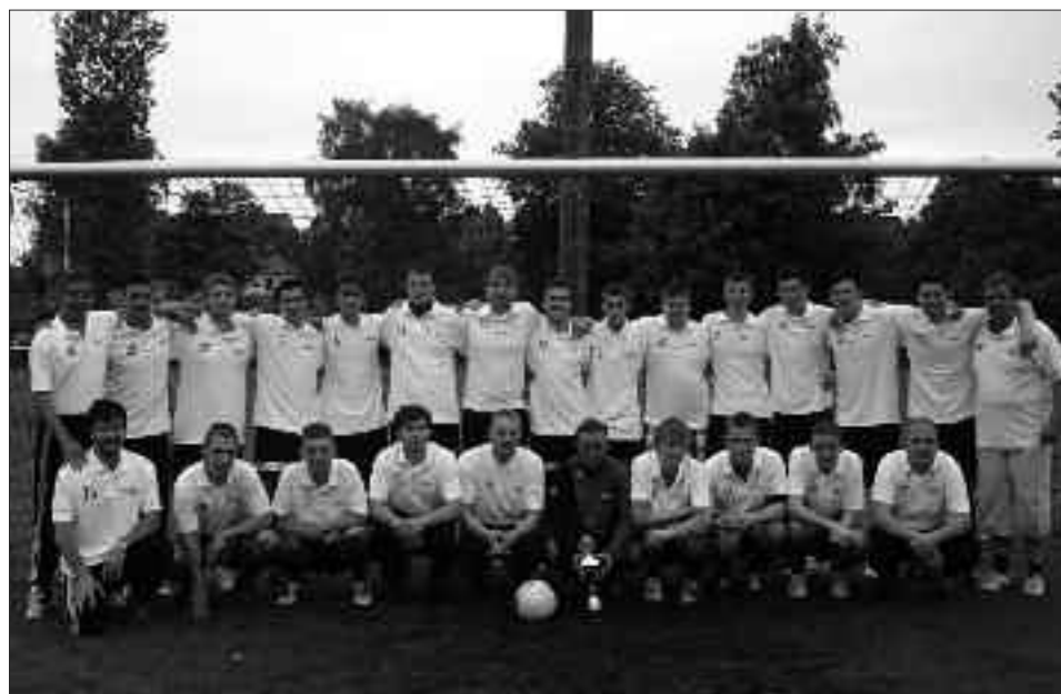
Staffelsieger 3. Kreisklasse 2009/2010, Staffel B: ESV Lok Seddin