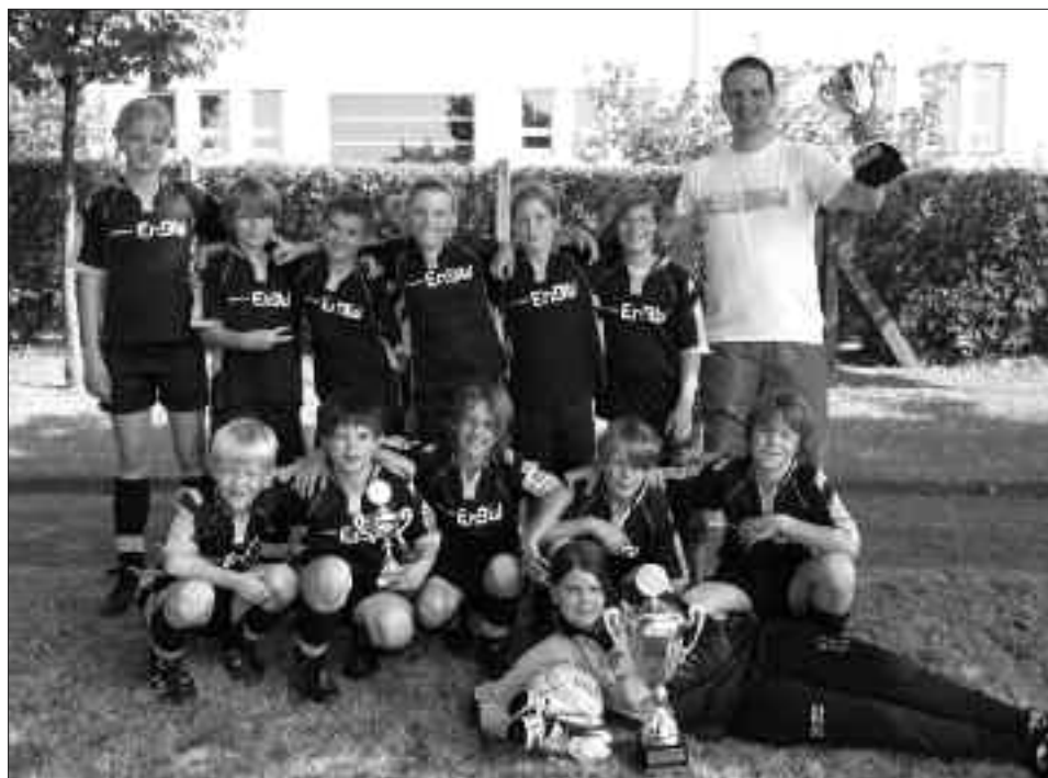
Kreismeister 2009/2010 E-Junioren: Fortuna Babelsberg I