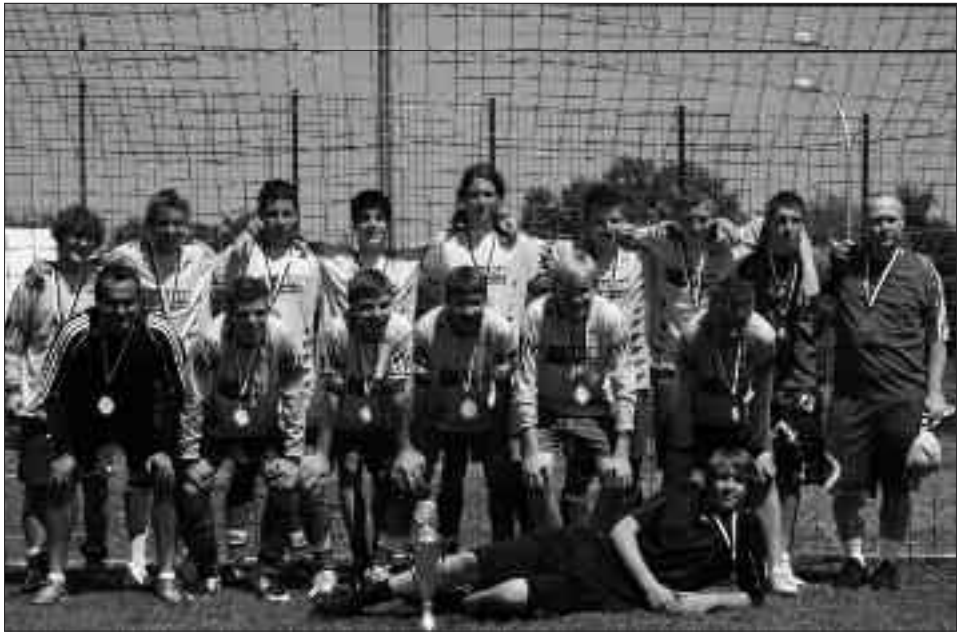
Kreismeister und Kreispokalsieger 2009/2010 B-Junioren: Blau-Gelb Falkensee