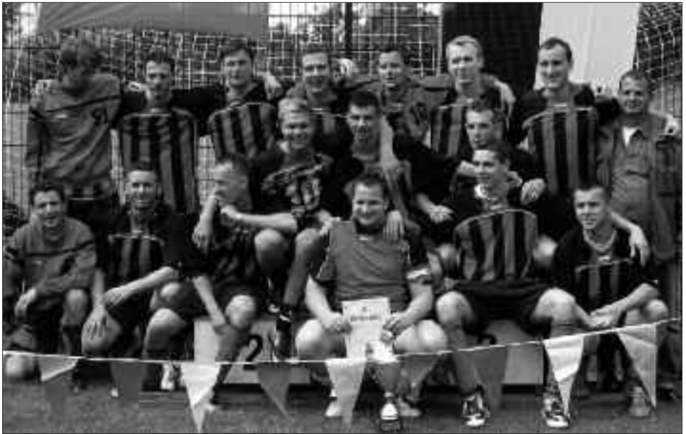
Sieger Wolfgang-Drescher-Pokal 2009/2010: ESV Lok Potsdam