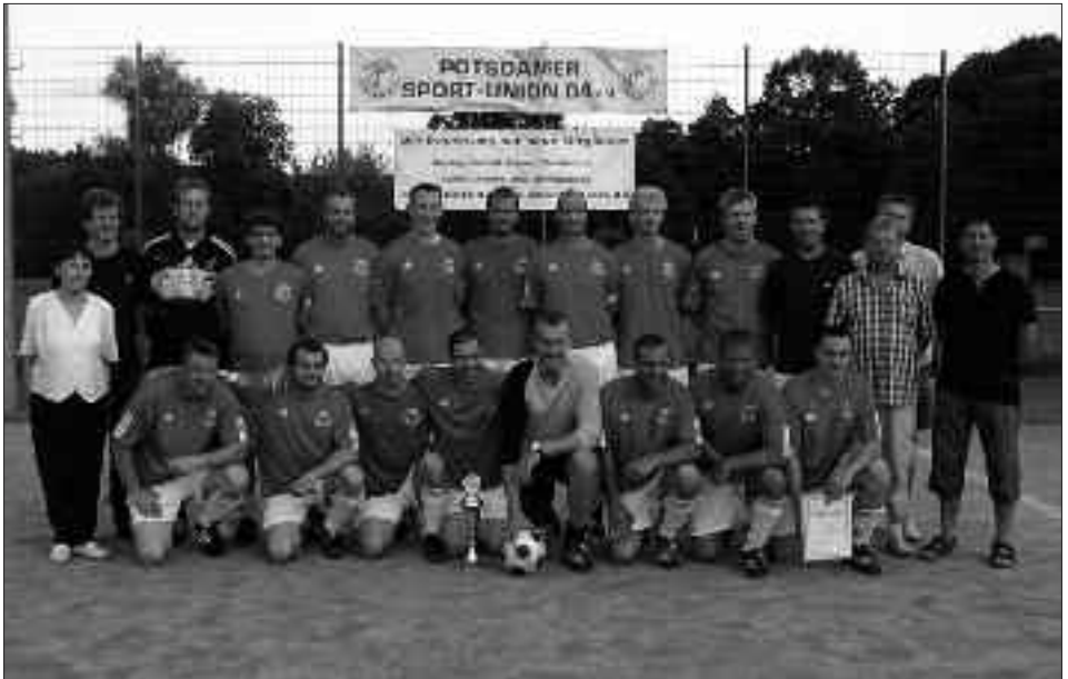
Senioren-Kreismeister Ü 35, 2009/2010: Potsdamer Sport-Union 04