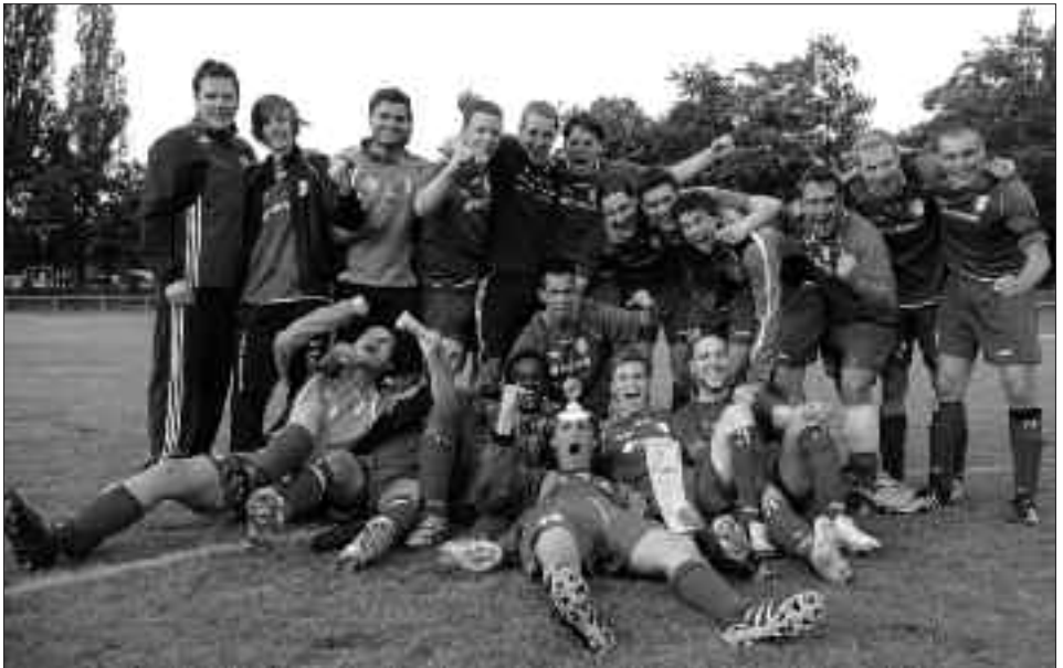
Kreispokalsieger 2009/2010: Potsdamer Kickers 94 II