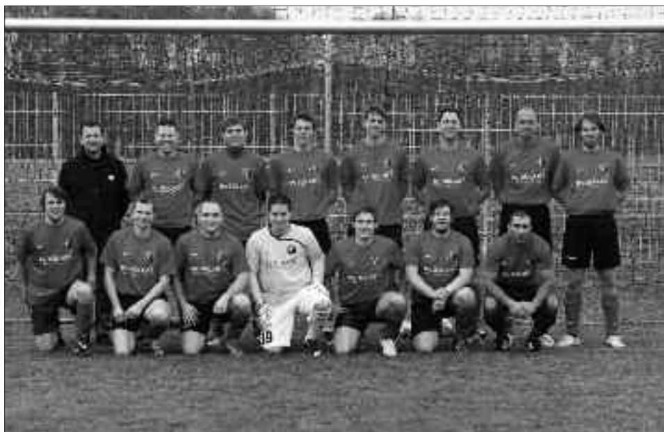
Staffelsieger 3. Kreisklasse 2009/2010, Staffel A: ESV Lok Elstal II