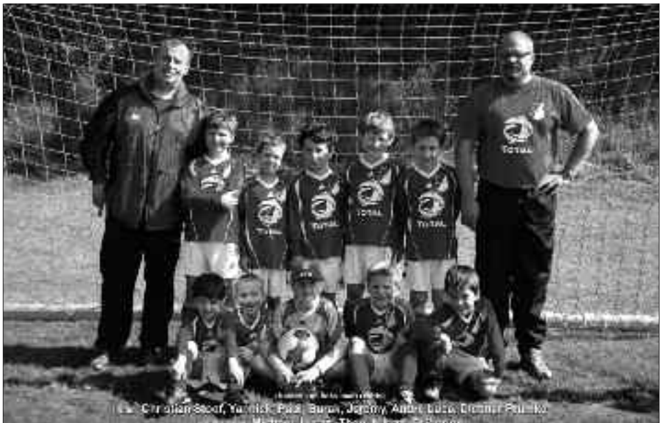
Staffelsieger Kreisklasse 2009/2010 F-Junioren: SG Rot-Weiß Groß Glienicke III