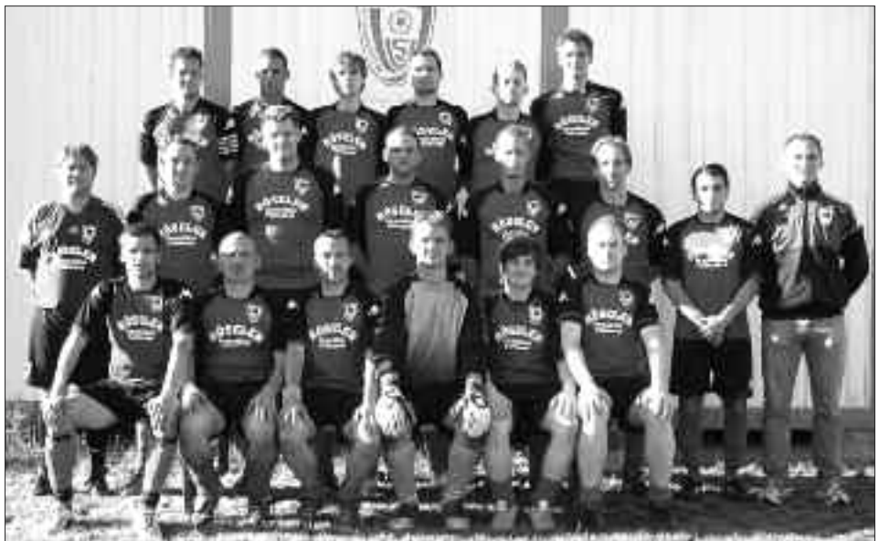
Staffelsieger 2. Kreisklasse 2009/2010: SV Dallgow 47