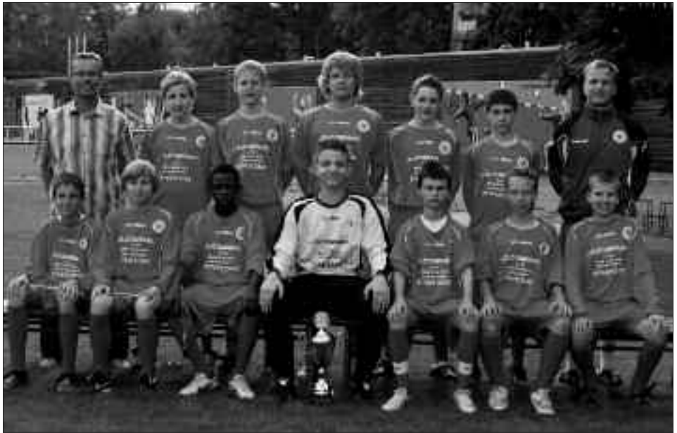
Staffelsieger Kreisklasse 2009/2010 C-Junioren: FV Turbine Potsdam 55