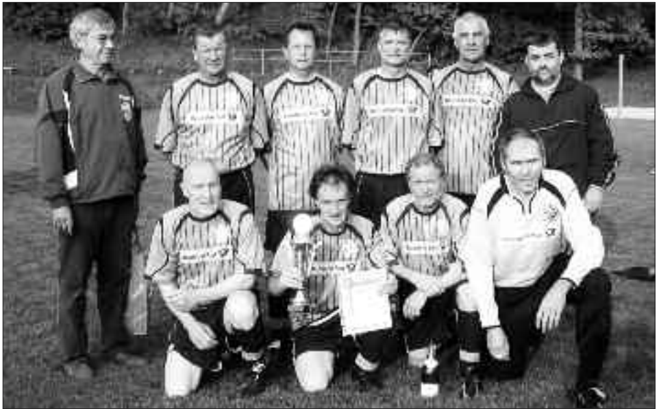
Senioren-Kreismeister Ü 50 und Staffelsieger Kreisliga, Staffel A 2009/2010: FSV 95 Ketzin/Falkenrehde