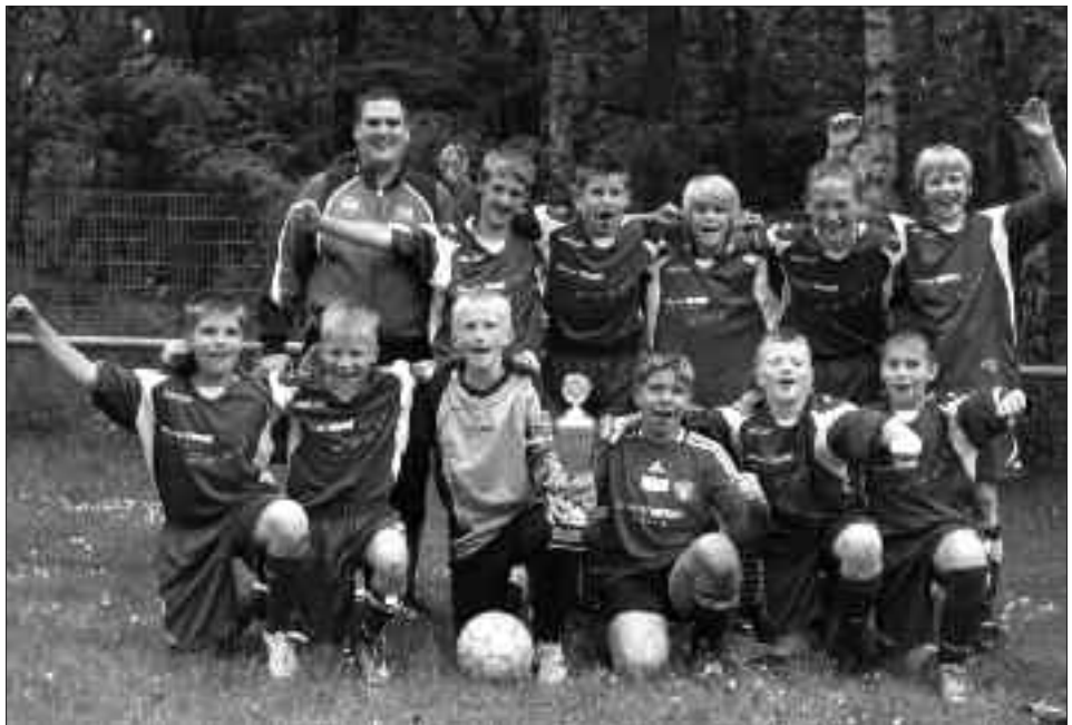
Staffelsieger Kreisklasse 2009/2010 D-Junioren: Eintracht Glindow