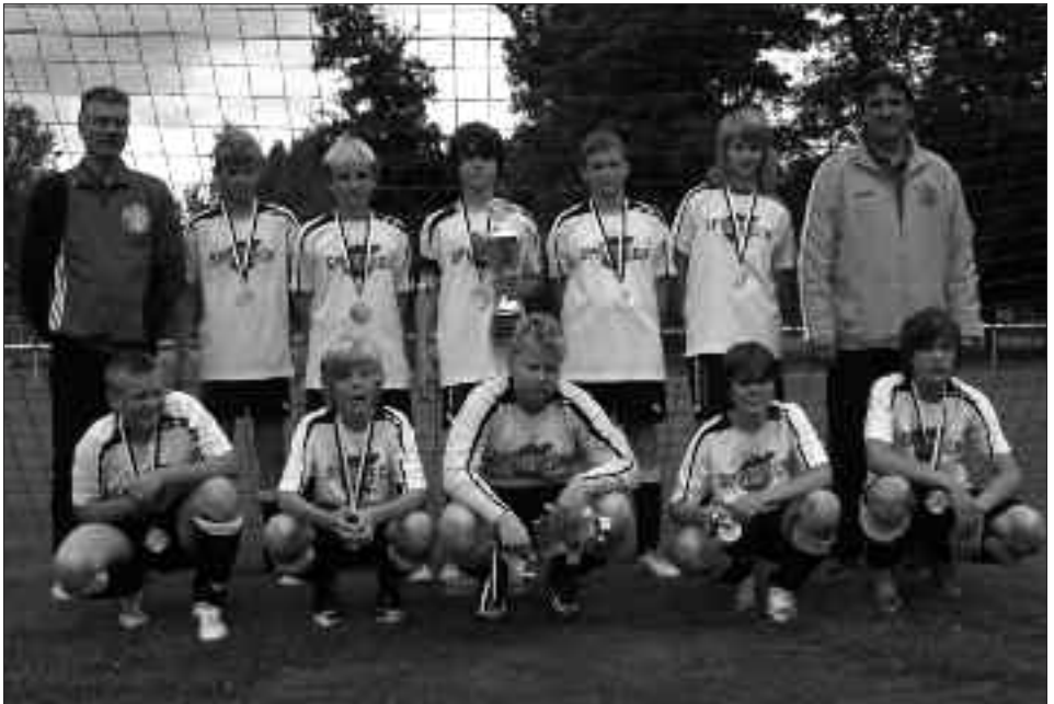
Staffelsieger Kreisliga 2009/2010 D-Junioren: FSV 95 Ketzin/Falkenrehde I