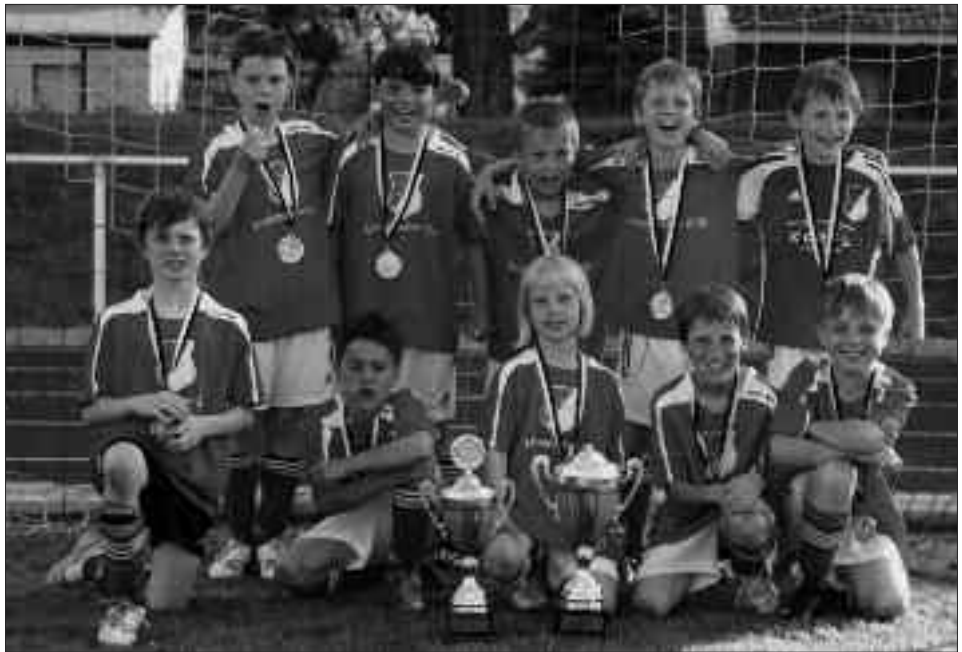
Kreismeister 2009/2010 F-Junioren: SG Rot-Weiß Groß Glienicke I