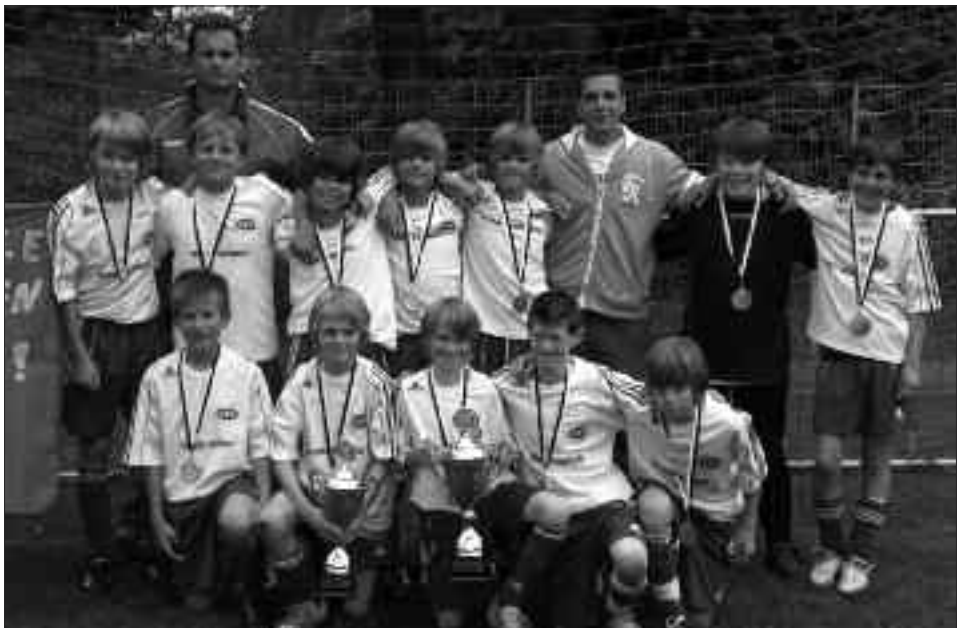
Kreismeister 2009/2010 D-Junioren: RSV Eintracht Teltow II