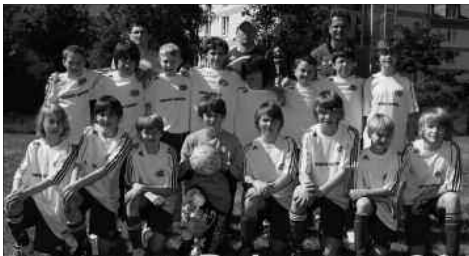
Staffelsieger Kreisklasse D-Junioren 2009/2010: RSV Eintracht Teltow IV