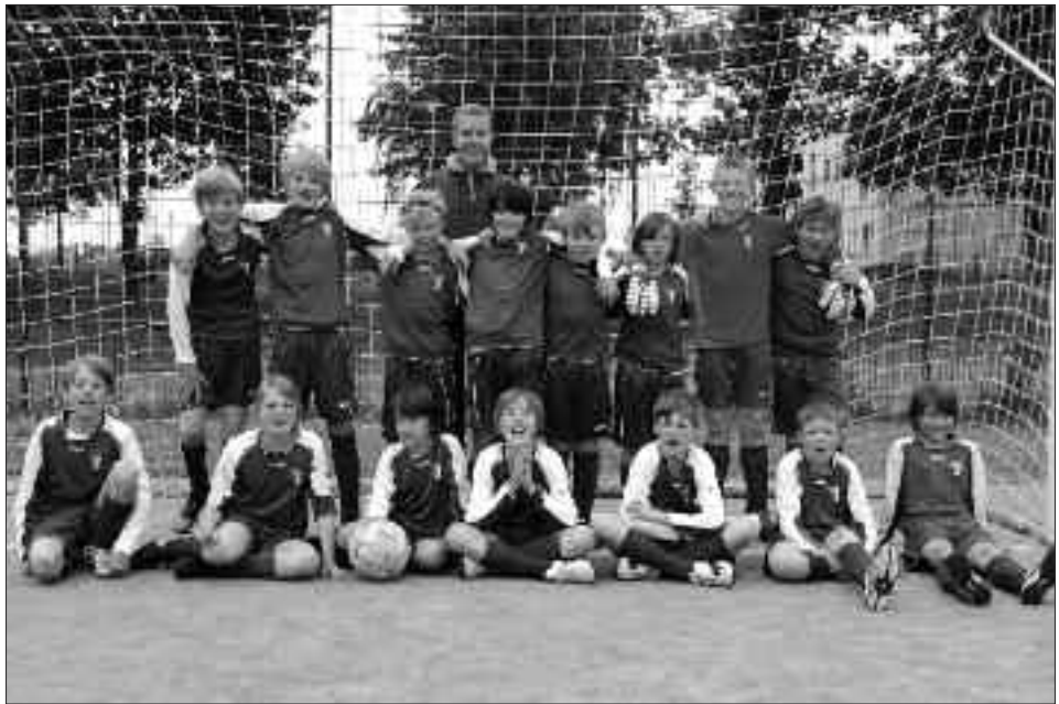
Staffelsieger Kreisklasse 2009/2010 E-Junioren: Potsdamer Kickers 94 III