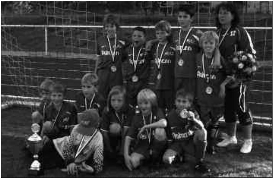
Staffelsieger Kreisliga Kreisliga 2009/2010 F-Junioren: RSV Eintracht Teltow I