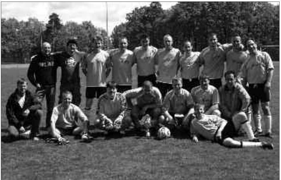
Meister Stadtklasse Potsdam 2009/2010: FV Turbine Potsdam 55 III