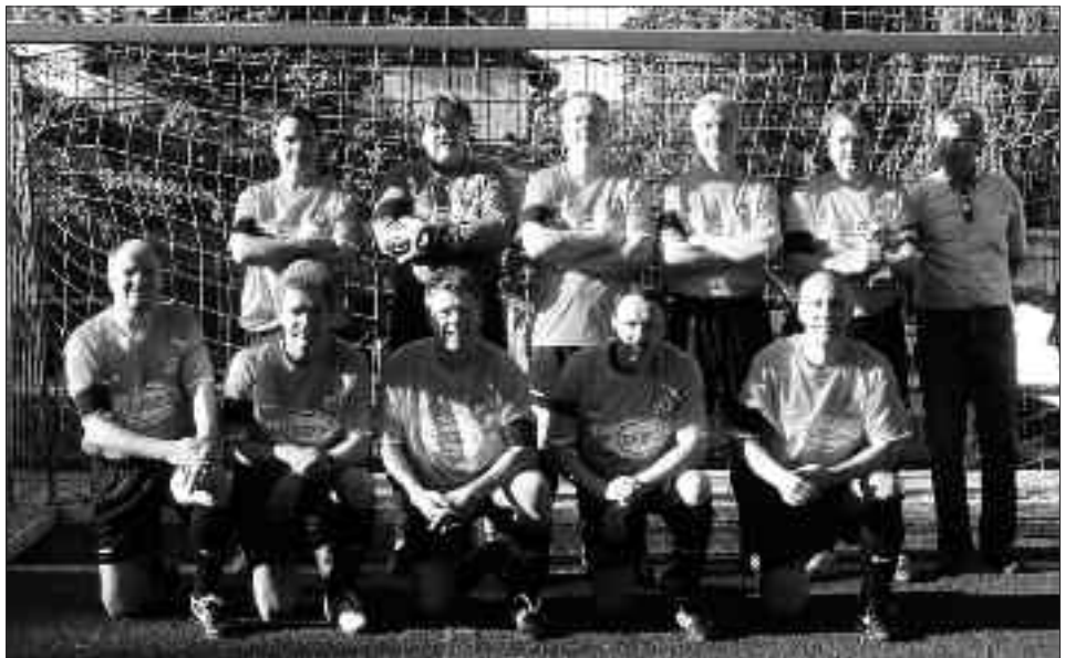
Sieger Seniorenpokal Ü 50 und Staffelsieger Kreisliga, Staffel B 2009/2010: FSV Babelsberg 74