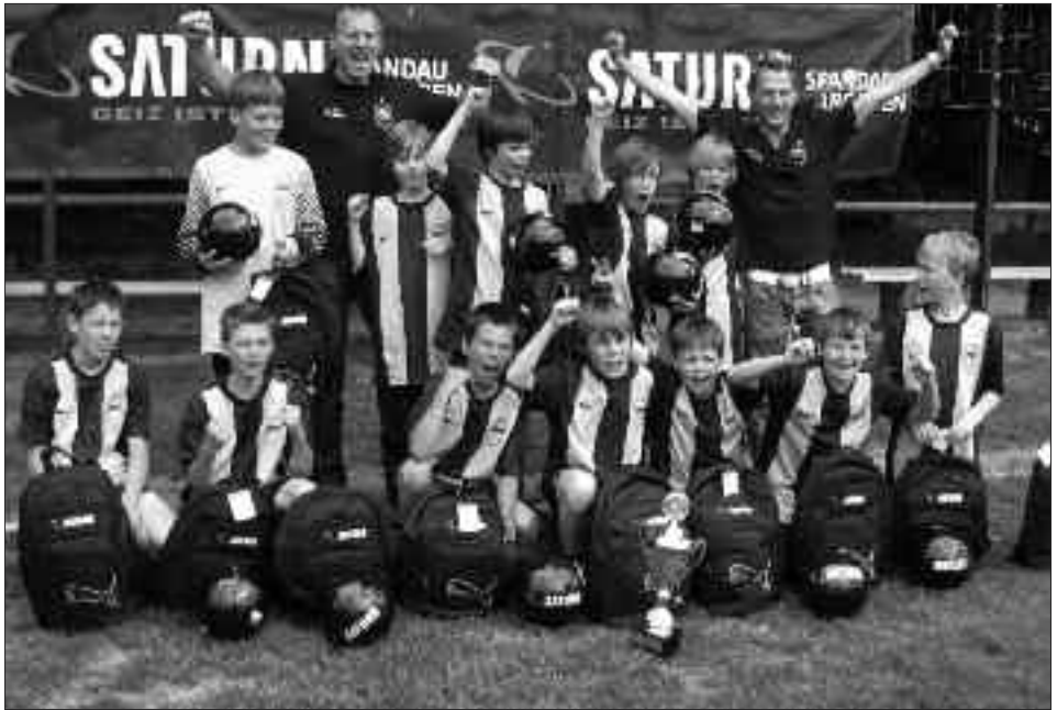
Kreispokalsieger und Staffelsieger Kreisliga 2009/2010 E-Junioren: Blau-Gelb Falkensee