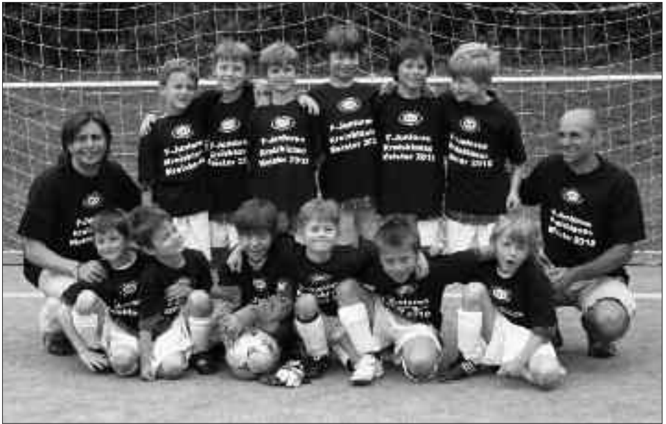
Staffelsieger Kreisklasse 2009/2010 F-Junioren: RSV Eintracht Teltow IV