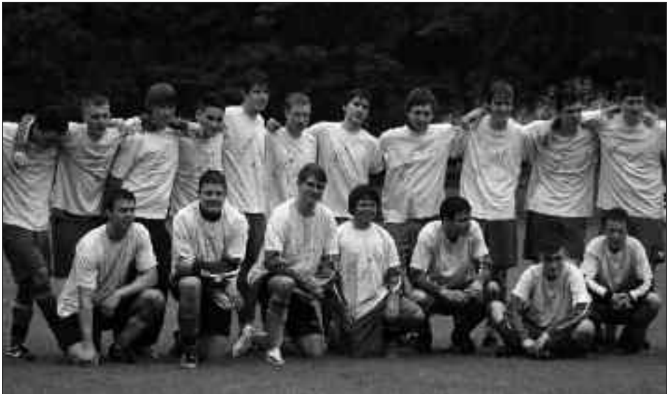
Kreismeister 2009/2010 A-Junioren: SG Bornim