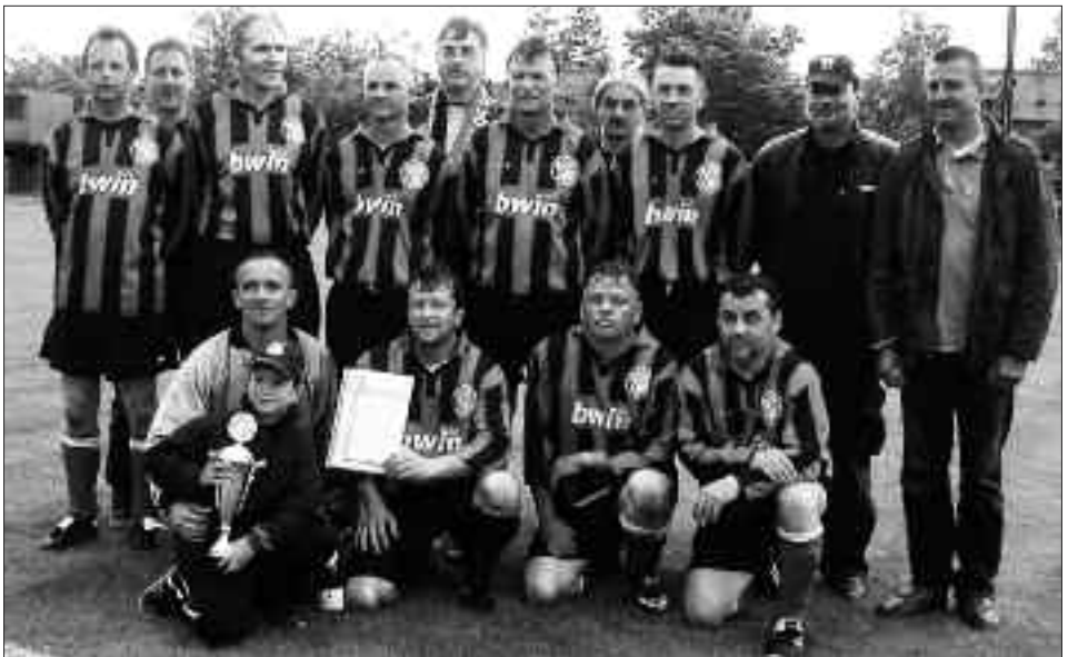
Senioren-Kreismeister Ü 40 2009/2010: FSV 95 Ketzin/Falkenrehde