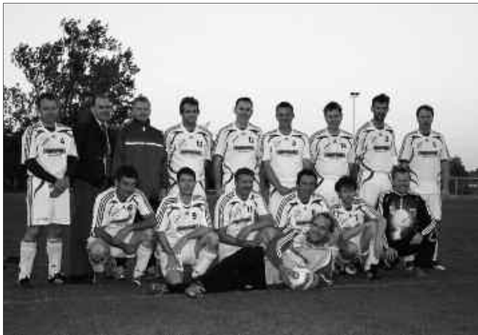
Staffelsieger Senioren-Kreisklasse Ü 40 2009/2010, Staffel B: SG Saarmund